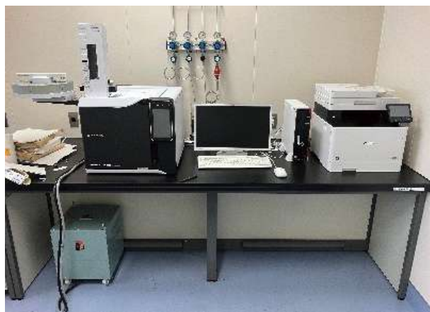
ガスクロマトグラフ 設置状態