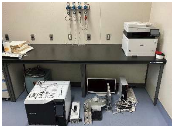
ガスクロマトグラフ離線後