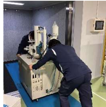
必要箇所に 養生をして搬出